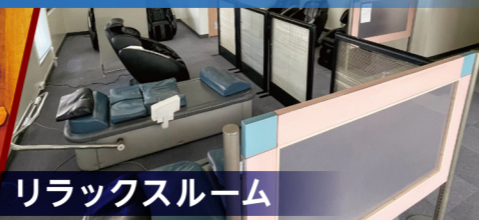
リラクゼーションルーム