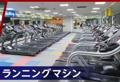
ランニングマシン

透明感・水質抜群(25m×6コース)のスイミングプールでウォーキングやアクアピクス、スイムをご利用いただけます。