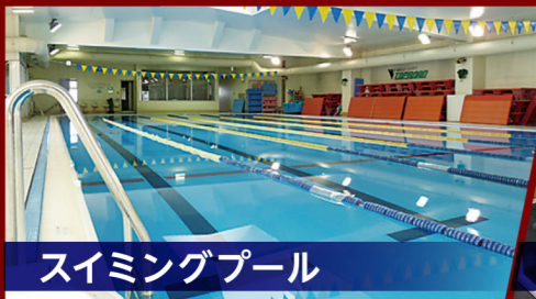
スイミングプール