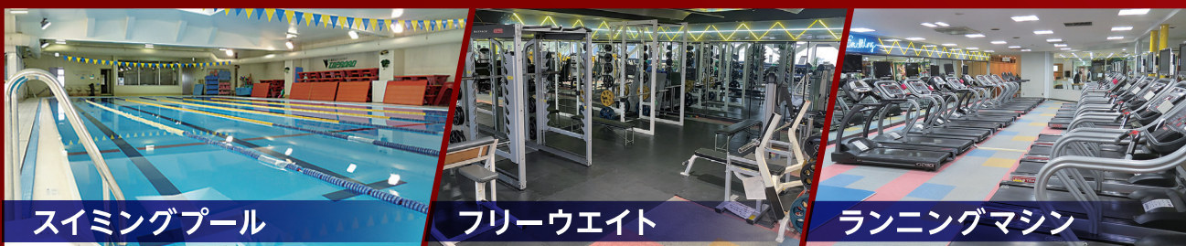
スイミングプール